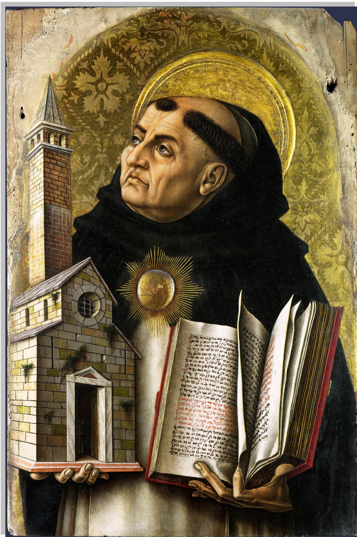
Фома Аквинский (1225-1274 гг.)